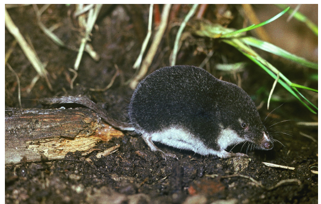
Bild: bit.ly/mäusedetektive , Sumpfspitzmaus ( Neomys milleri ), Andera Milos

Insgesamt konnten in den Proben 25 verschiedene Arten Kleinsäuger nachgewiesen wer-