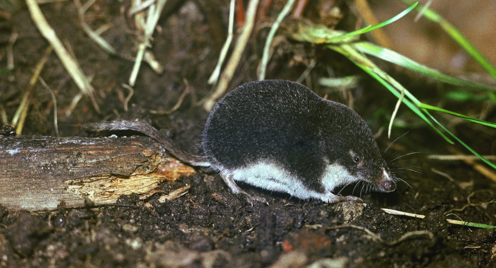
Bild: bit.ly/mäusedetektive , Sumpfspitzmaus ( Neomys milleri ), Andera Milos