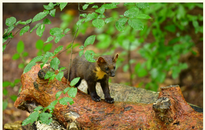
Bild: Baummarder