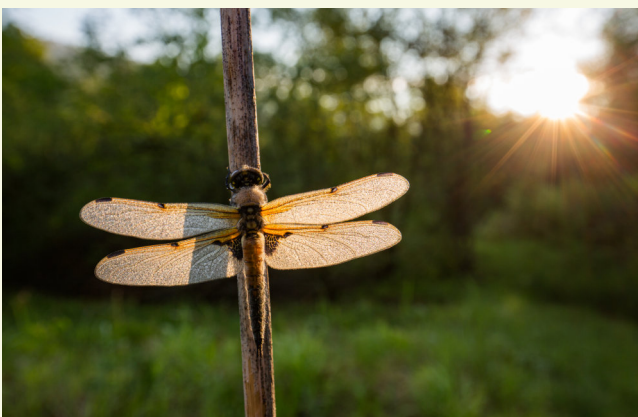
Bild: Libellula quadrimaculata