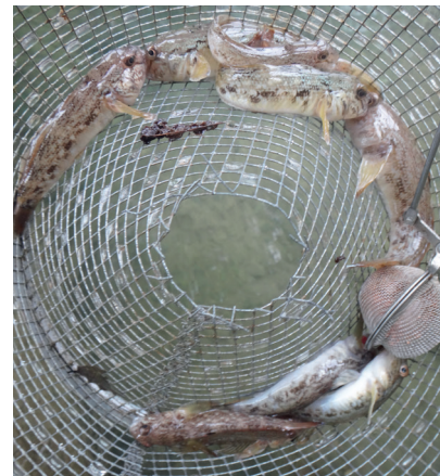
Die Fangstatistik (links) bei Basel zeigt, wie die Schwarzmundgrundel andere Arten verdrängt. Nicht nur einheimische Fischarten sind betroffen, sondern auch eingeschleppte Grundel- und Krebsarten. Der Fang geschieht mit Reusen (rechts).