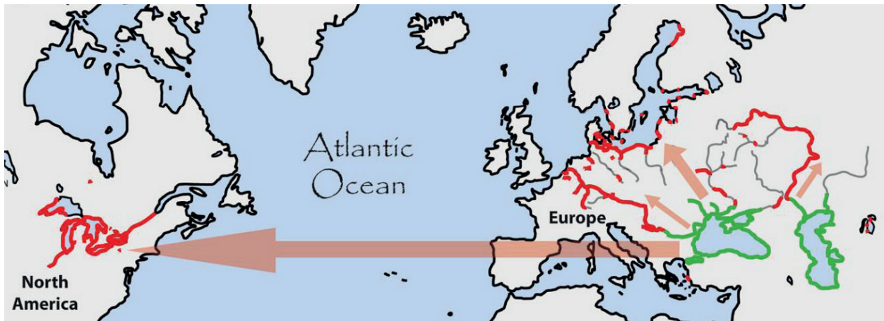
Von ihrem ursprünglichen Verbreitungsgebiet (grün) haben sich die Schwarzmundgrundeln viele neue Lebensräume (rot) erschlossen.

Bucht aus eroberte sie Küstengewässer und Zuflüsse der Ostsee. Auch in der Nordsee tauchte sie plötzlich auf, wie etwa im niederländischen Rheindelta. Doch dort konnte sie sich nur im flussnahen Brackwasser niederlassen. Forschende konnten sich diesen Umstand nur damit erklären, dass die Ostsee weitaus weniger salzhaltig ist als die Nordsee. So enthält ein Kilogramm Ostseewasser gerademal 8 Gramm Salz, in der Nordsee sind es 35 Gramm. Andererseits kommen in der Ursprungsregion am Kaspischen Meer auch Grundelbestände in Wasser mit über 40 Gramm Salz vor. Das erklären sich die Forschenden nun damit, dass im Kaspischen Meer vor allem das Salz Kalziumsulfat vorkommt, in den restlichen Weltmeeren jedoch Natriumchlorid, unser Speisesalz. Die Grundeln könnten etwas empfindlicher auf das für sie ungewohnte Natriumchlorid sein.