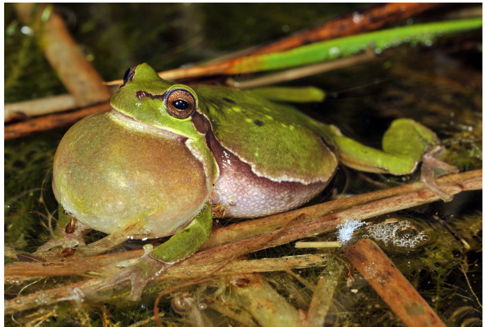
Laubfrösche werden nur ein bis zwei Jahre alt und pflanzen sich demnach auch nur ein bis zweimal fort.

Ein Teil der juvenilen und der adulten Tiere verlassen den Lebensraum, in welchem sie geboren sind, und wandern zu anderen Gewässern. Solche Wanderungen sind für die Überlebensfähigkeit der Populationen von grosser Bedeutung. Fehlende Fortpflanzung in einem Lebensraum – das kommt öfter vor als man denkt – kann durch Einwanderung kompensiert werden.