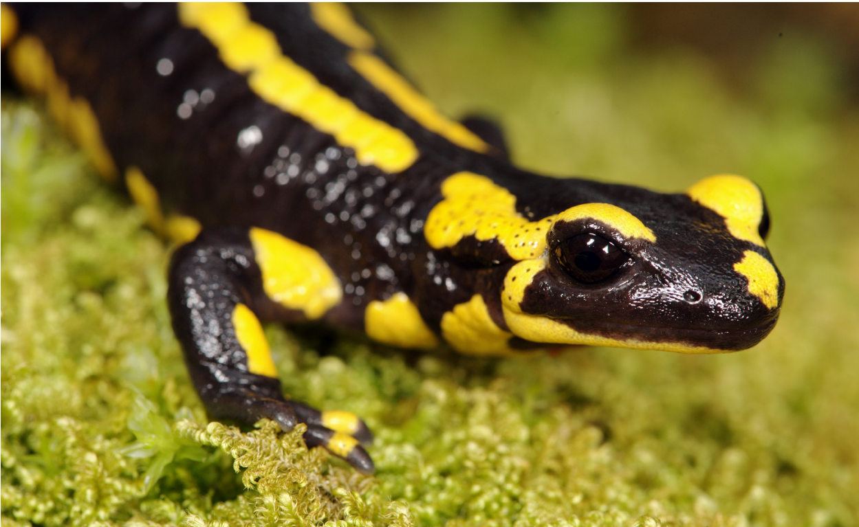
Feuersalamander können fünf bis zehn Jahre alt werden und pflanzen sich mehrmals fort.

Nach einem kurzen Überblick über die Gefährdungsursachen soll hier dargestellt werden, wie man Amphibien „richtig“ schützt. Zuerst soll aber beschrieben werden, wie Amphibienpopulationen funktionieren.